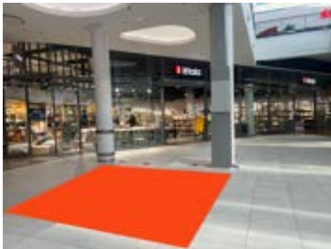
Paikka 4 • Iittala 4 x 4 m