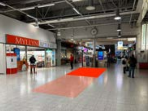
Paikka 1 • Myllyn Apteekki 3 x 4 m Optio laajentaa paikka 3 x 10 m