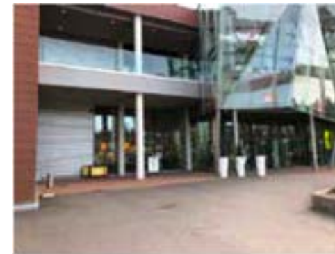
Paikka 7 • Ulkopaikka, sähkötilattava