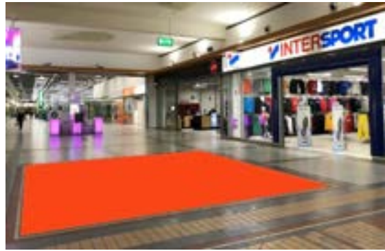
Paikka 2 • Intersport 6 x 5 m Ei sähköä, ei myyntipromootiota