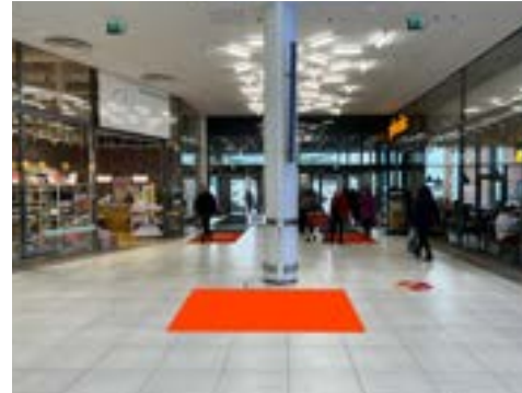
Paikka 6 • Picnic 2 x 2,5 m