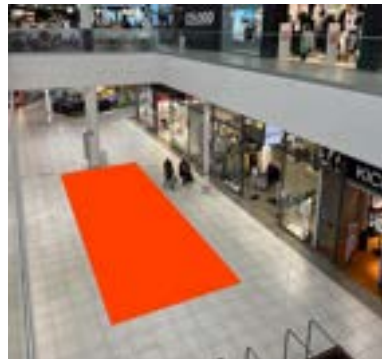
Paikka 4 • Halti 4 x 10 m